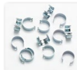
Anelle Ferma Coprirete Ø 25 mm