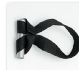
Maniglia in Poliestere ad Anello

Meccanismo da inserimento a due pieghe con apertura frontale tramite sollevamento. La struttura è realizzata con tubo Ø 25 in acciaio ad alta resistenza e verniciata in forno con polveri epossidiche. Il telaio portante è costituito da una fiancata in lamiera con fori predisposti per il fissaggio nel cassone. Il piano letto è in doghe di legno e il piano seduta è a cinghie elastiche. A questo meccanismo può essere abbinato un materasso in poliuretano espanso (cm 10/12x190).