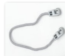
Maniglia in Poliestere con Ganci