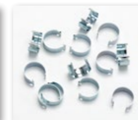
Anelle Ferma Coprirete Ø 25 mm