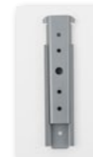
Baionette Armetal NEW con foro passante