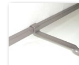
Traversa di Collegamento